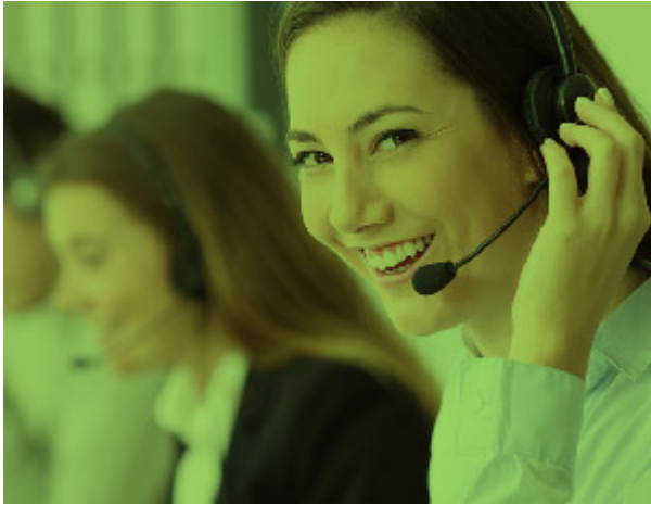
Service de téléassistance Bluelinea